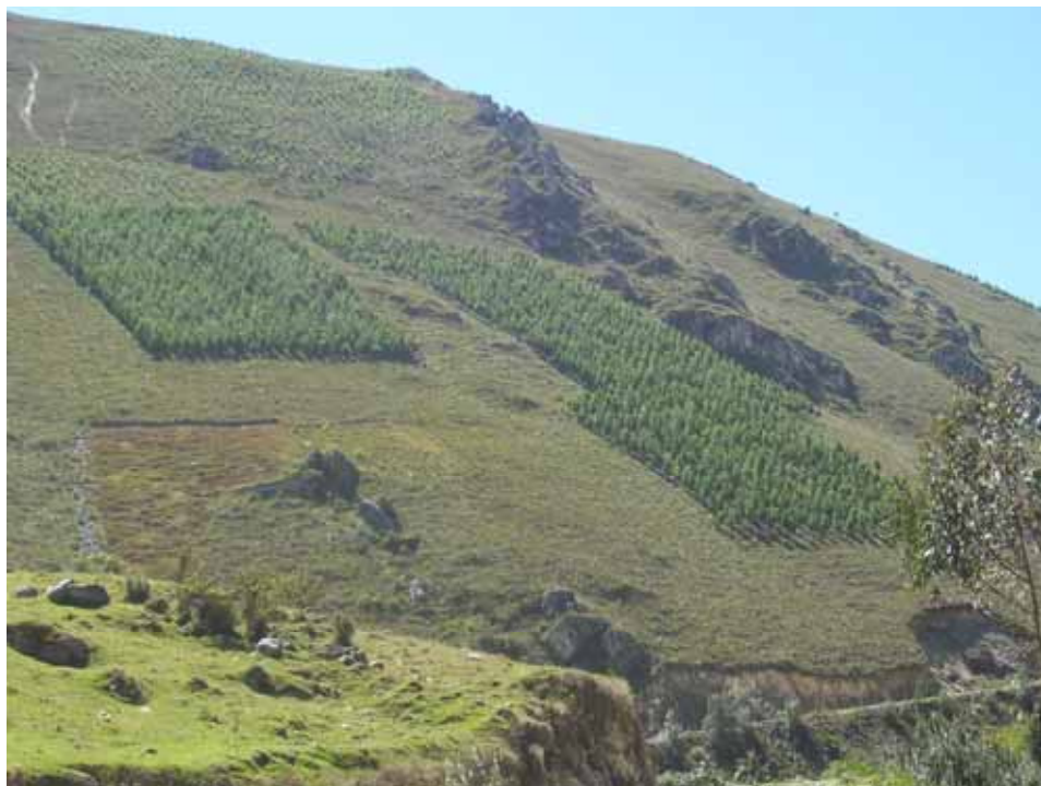
PLANTACION DE PINO EN MACIZO DE PROTECCION EN HUASAHUASI 2001 – JUNIN