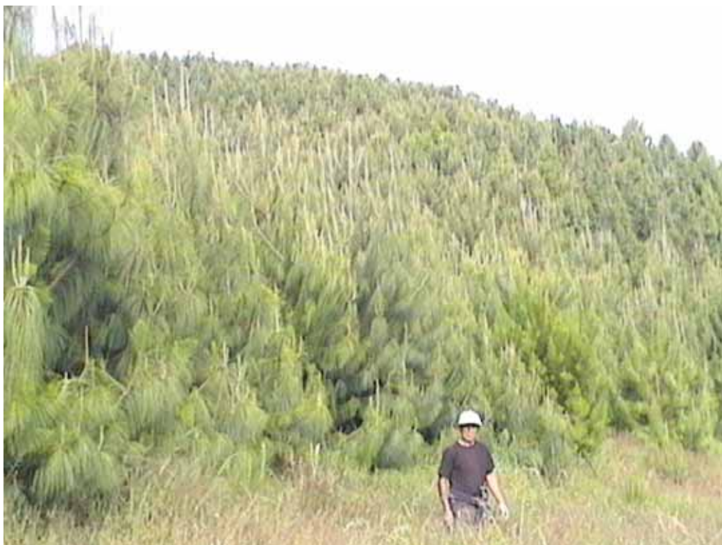
PLANTACIONES DE PINUS PATULA CASERIO ALTO CHAQUIL CAMPAÑA 2004-CAJAMARCA