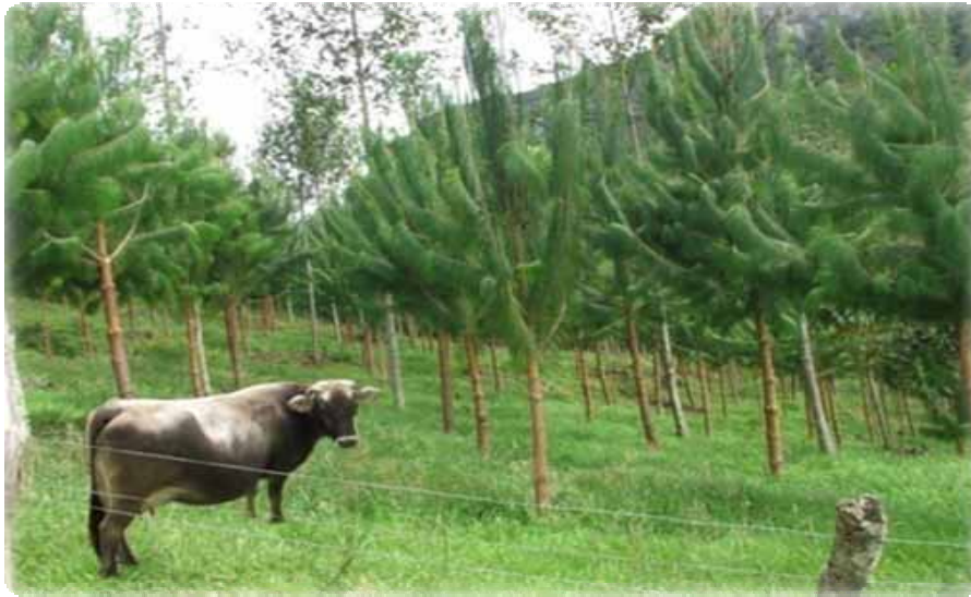
SILVOPASTURA EN AMAZONAS