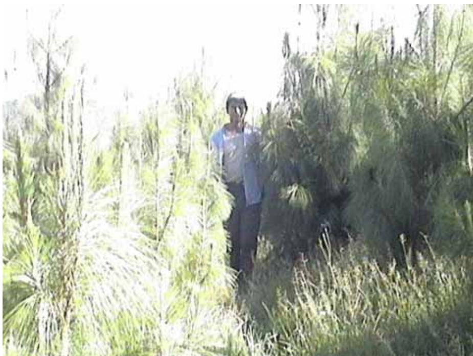
PLANTACIONES DE PINUS PATULA CASERIO NUEVO LAUREL CAMPAÑA 2004-CAJAMARCA