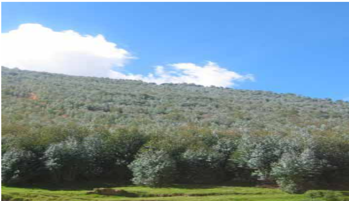
MACIZO DE PRODUCCIÓN PARA MANEJO DE REBROTES – HUAMACHUCO - LA LIBERTAD