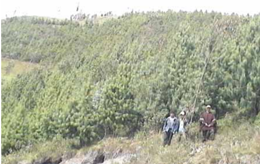
PLANTACIONES DE PINUS PATULA CASERIO SAN FELIPE CAMPAÑA 2003-CAJAMARCA