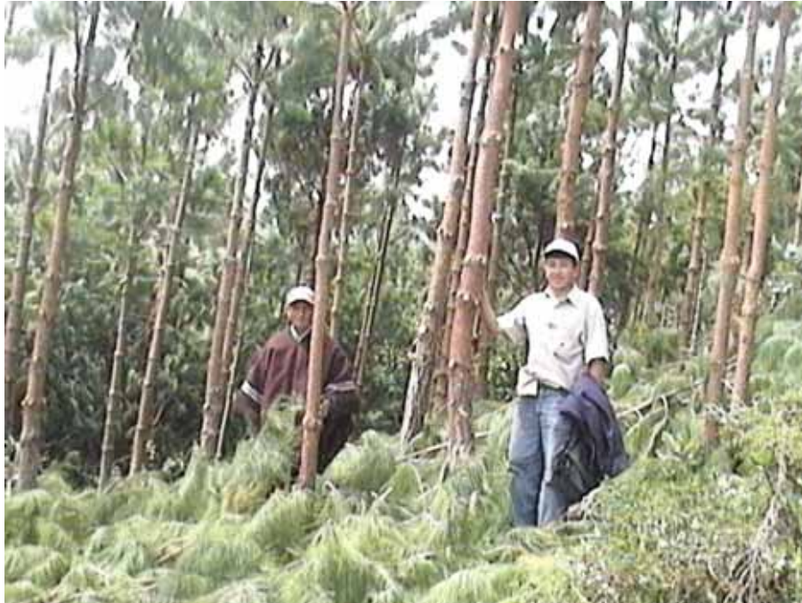
PODA EN PLANTACIONES DE PINUS PATULA CASERIO DE SAN FELIPE - CAJAMARCA