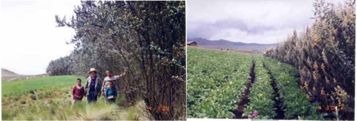
PLANTACIÓN AGROFORESTAL BARRO NEGRO 2001 OTUZCO LA LIBERTAD