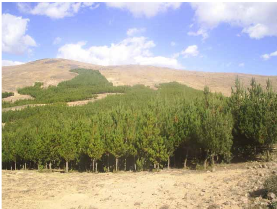
PLANTACIONES FORESTALES DE PINO DE 7 AÑOS EN PAUCARTAMBO - CUSCO San Juan de Buena y Huancarani