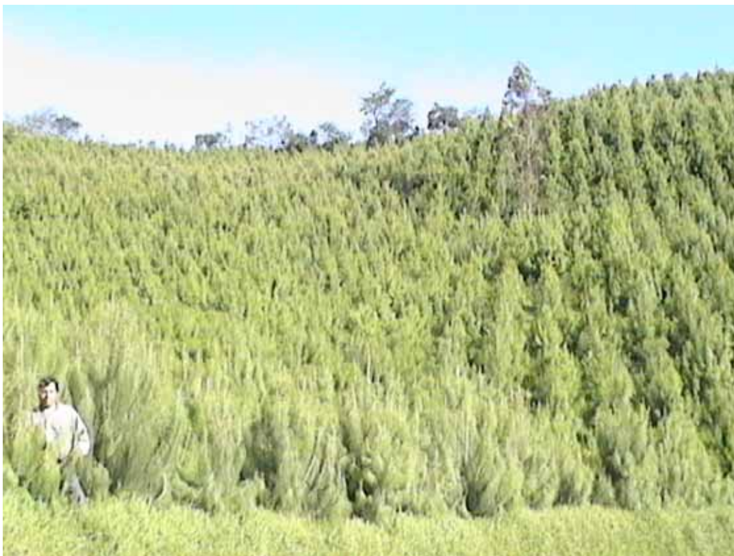
PLANTACIONES DE PINUS PATULA CASERIO ALTO CHAQUIL CAMPAÑA 2004-CAJAMARCA