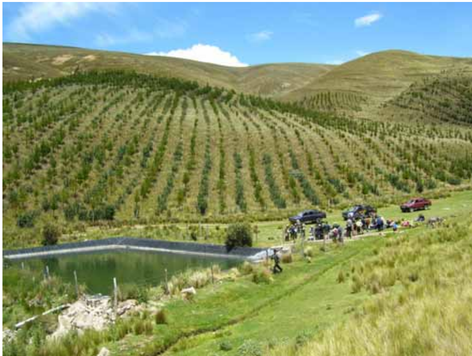
PLANTACIÓN SILVOPASTORIL 2001 EN LA CC DE AYAS – TARMA – JUNIN