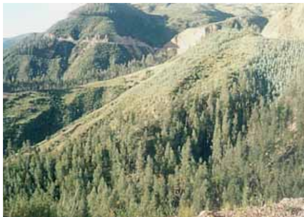
PLANTACION AGROFORSTAL- HUAMACHUCO Y TAYABAMBA LA LIBERTAD